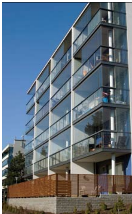
KOY Merikorttikuja 4, Helsinki