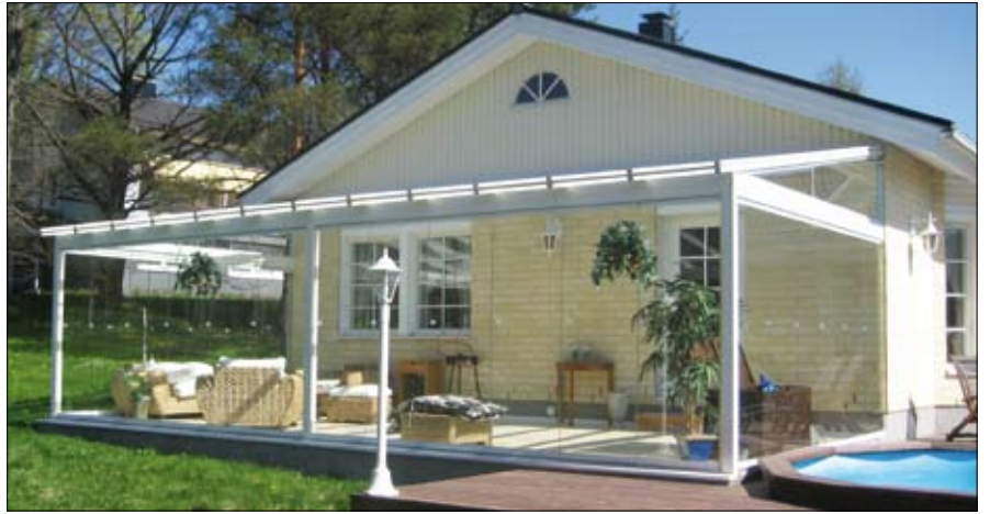
NIKA-Terassilasitus, omakotitalo, Kirkkonummi