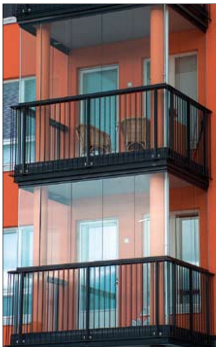
As. Oy Keisari, Vantaa